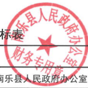
2021年政府办政府会务活动经费绩效目标表