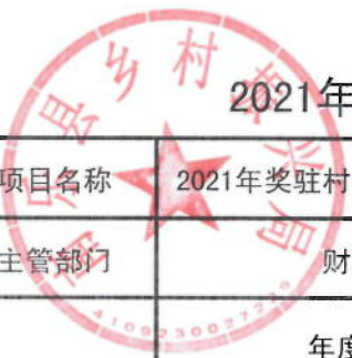
2021年驻村书记及队员等补助资金绩效目标表