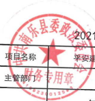
2021年平安建设示范村专项经费绩效目标表