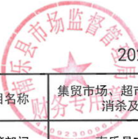
2021年南乐县市场监管局绩效目标表