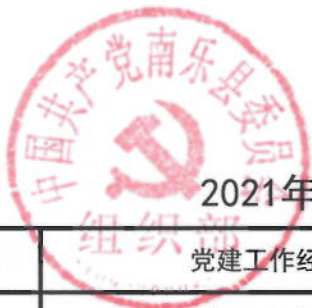
2021年南乐县委组织部绩效目标表