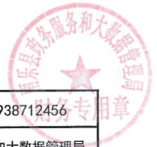
2021年雪亮工程专线绩效目标表