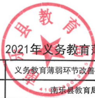
2021年义务教育薄弱环节改善与能力提升绩效目标表