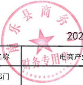
2021年电商产业园运营绩效目标表