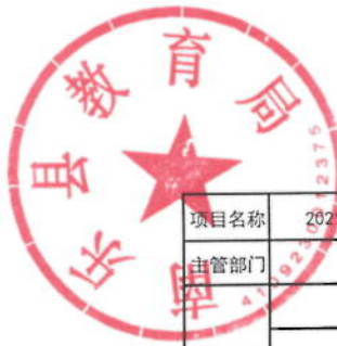
2021年县城区选调教师经费绩效目标表