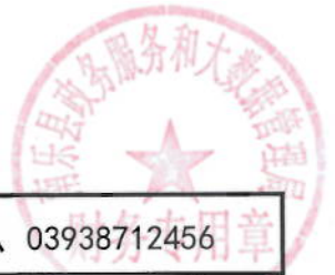
2021年电子政务外网专线绩效目标表