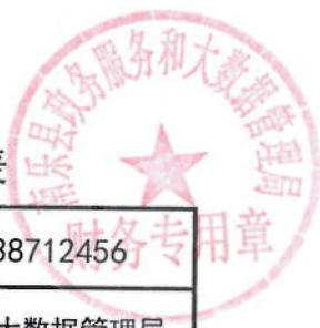
2021年行政审批系统网络平台建设（移动）绩效目标表