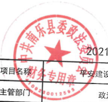
2021年平安建设专项经费绩效目标表