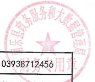
2021年系统运行维护费绩效目标表