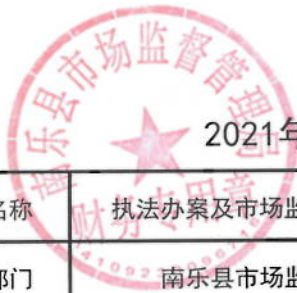
2021年南乐县市场监管局绩效目标表