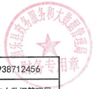
2021年政务大厅疫情防控物资及设备购置绩效目标表