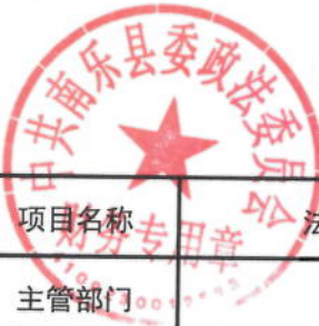
2021年法学会工作专项经费绩效目标表