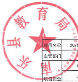
2021年教师培训经费绩效目标表