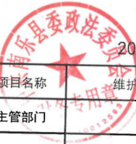
2021年维护稳定工作专项经费绩效目标表