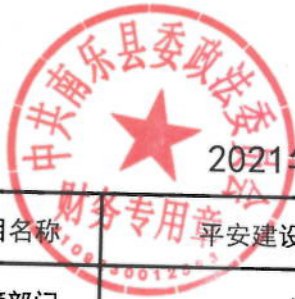
2021年平安建设奖励专项经费绩效目标表