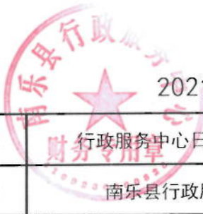
2021年行政服务中心绩效目标表