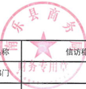
2021年信访稳定绩效目标表