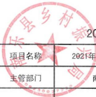
2021年驻村书记专项工作经费绩效目标表