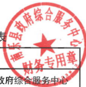
2021年案件诉讼费用和律师服务费绩效目标表