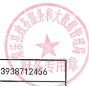
2021年专家评审费绩效目标表