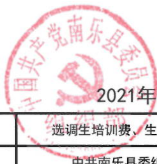
2021年南乐县委组织部绩效目标表