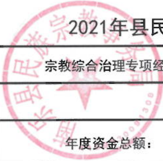
2021年县民族宗教事务局绩效目标表