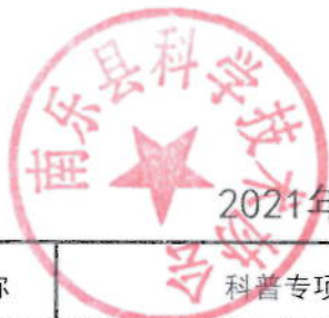
2021年科普专项经费项目绩效目标表