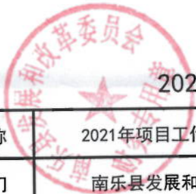
2021年项目工作经费绩效目标表