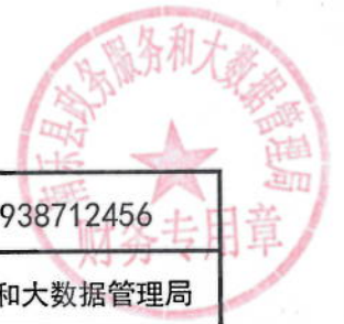
2021年项目可研经费绩效目标表