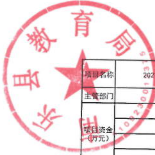
2021年特岗教师面试经费绩效目标表