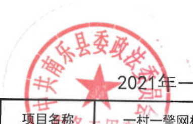
2021年一村一警网格化管理专项经费绩效目标表