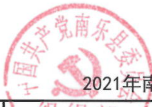
2021年南乐县委组织部绩效目标表