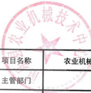
2021年农业机械安全生产监理绩效目标表