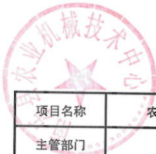
2021年农机合作社发展绩效目标表