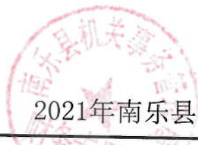
2021年南乐县事务管理局绩效目标表