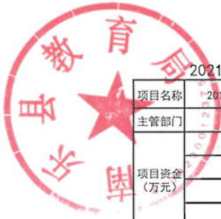
2021年2019级普通高中学生学业水平考试经费绩效目标表