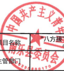
2021年共青团南乐县委绩效目标表