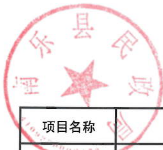
2021年困难群众救助补助绩效目标表