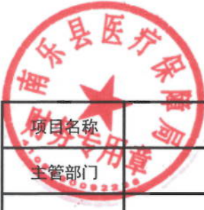
2021年城乡医疗救助绩效目标表