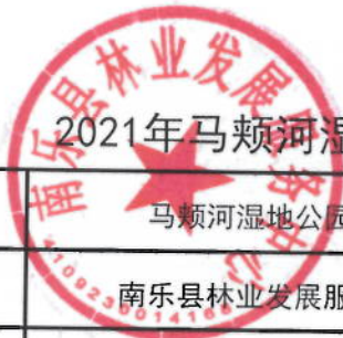
2021年马颊河湿地公园电费及养护项目绩效目标表