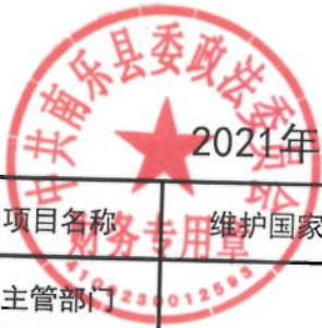
2021年维护国家政治安全工作专项经费绩效目标表