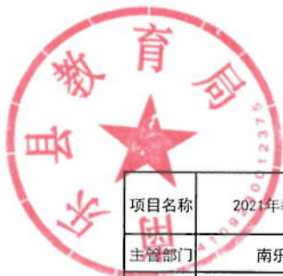
2021年教育督导经费绩效目标表