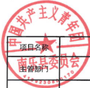
2021年共青团南乐县委绩效目标表