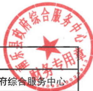
2021年行政复议、行政诉讼经费绩效目标表