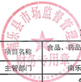
2021年南乐县市场监管局绩效目标表