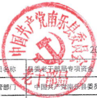
2021年老干部局绩效目标表