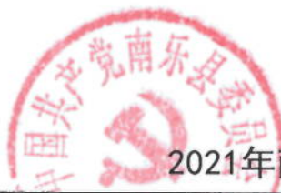
2021年南乐县委组织部绩效目标表