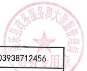
2021年生态农业信息化专线绩效目标表