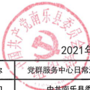
2021年南乐县委组织部绩效目标表