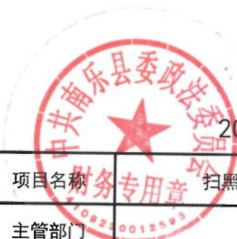
2021年扫黑除恶专项经费绩效目标表