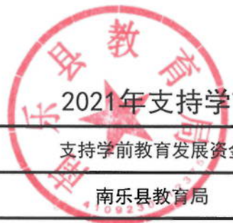
2021年支持学前教育发展资金绩效目标表