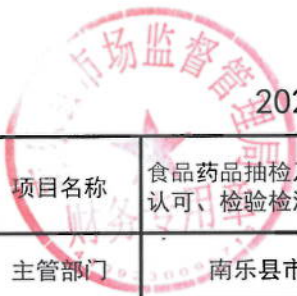
2021年南乐县市场监管局绩效目标表