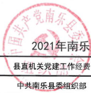
2021年南乐县委组织部绩效目标表