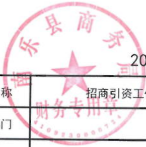
2021年招商引资绩效目标表