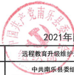
2021年南乐县委组织部绩效目标表