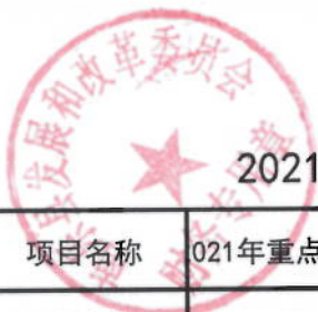
2021年重点项目管理办公室办公经费绩效目标表