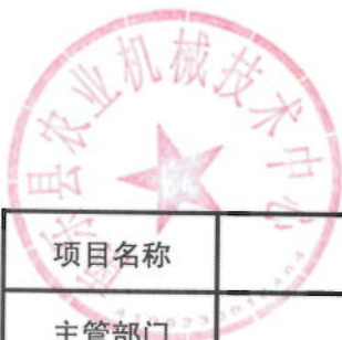
2021年农机装备绩效目标表