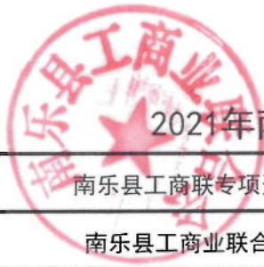
2021年南乐县工商联绩效目标表