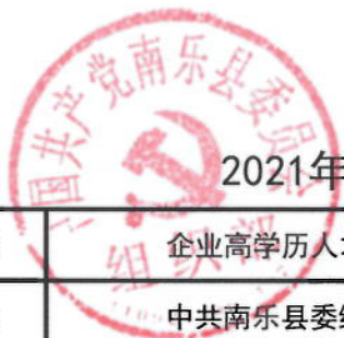
2021年南乐县委组织部绩效目标表